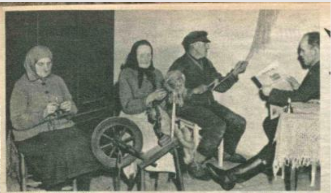
Vakarēšana lauku mājās.