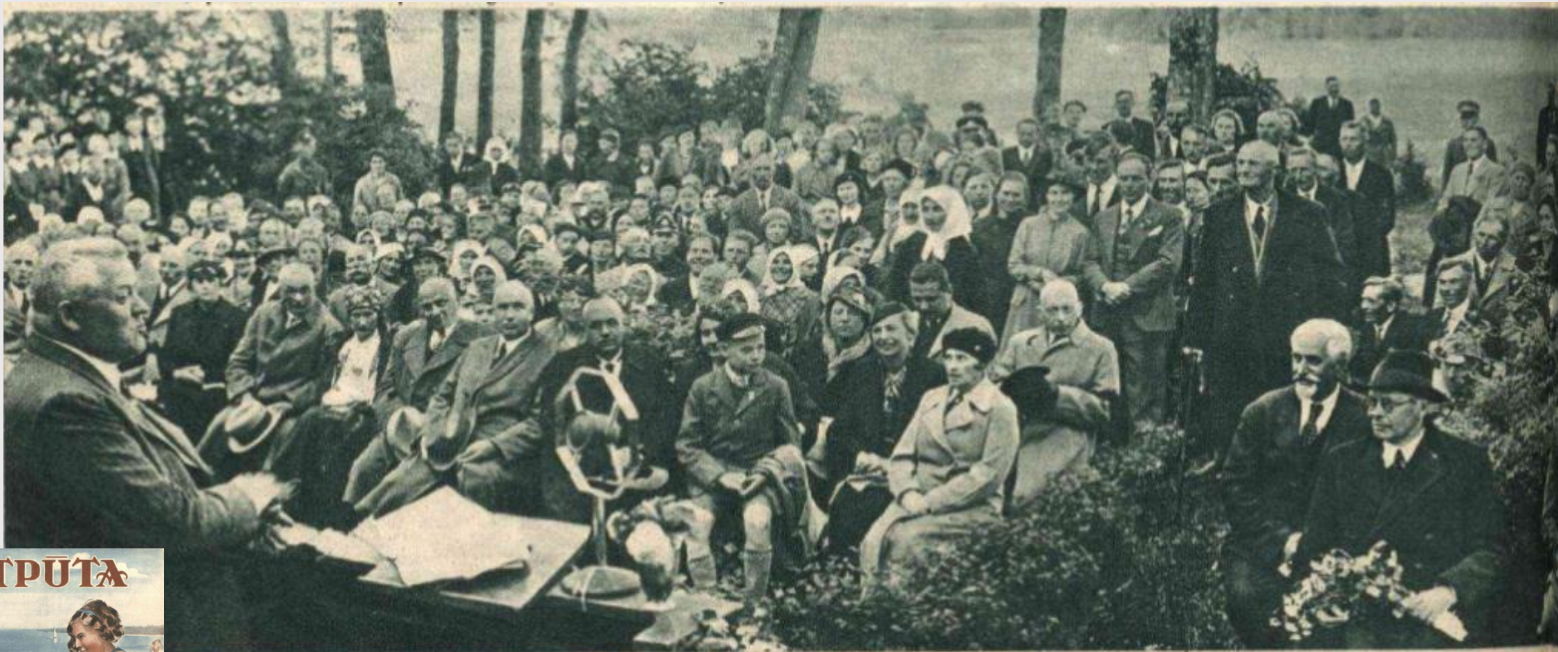
Vakarēšanas dalībnieki Lugažos. 30. maijā Valsts prezidents Dr. K. Ulmanis ieradās Lugažu 6-kl. pamatskolā un, atzīmējot Vidū sēd iekšlietu min. V. Gulbis, aiz viņa lugu