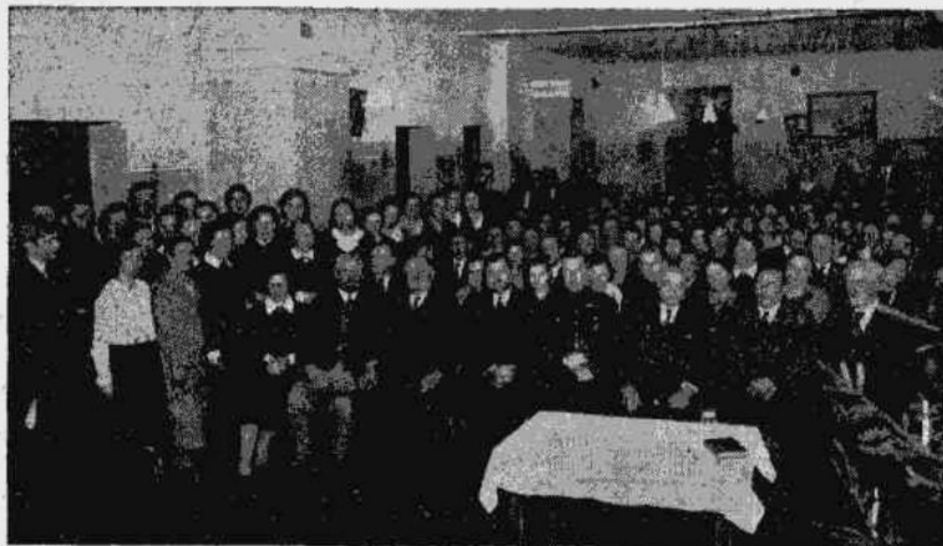
Lugažu pagasta 100. vakarēšanas dalībnieki. (Skat. rakstu 20. lapp.)