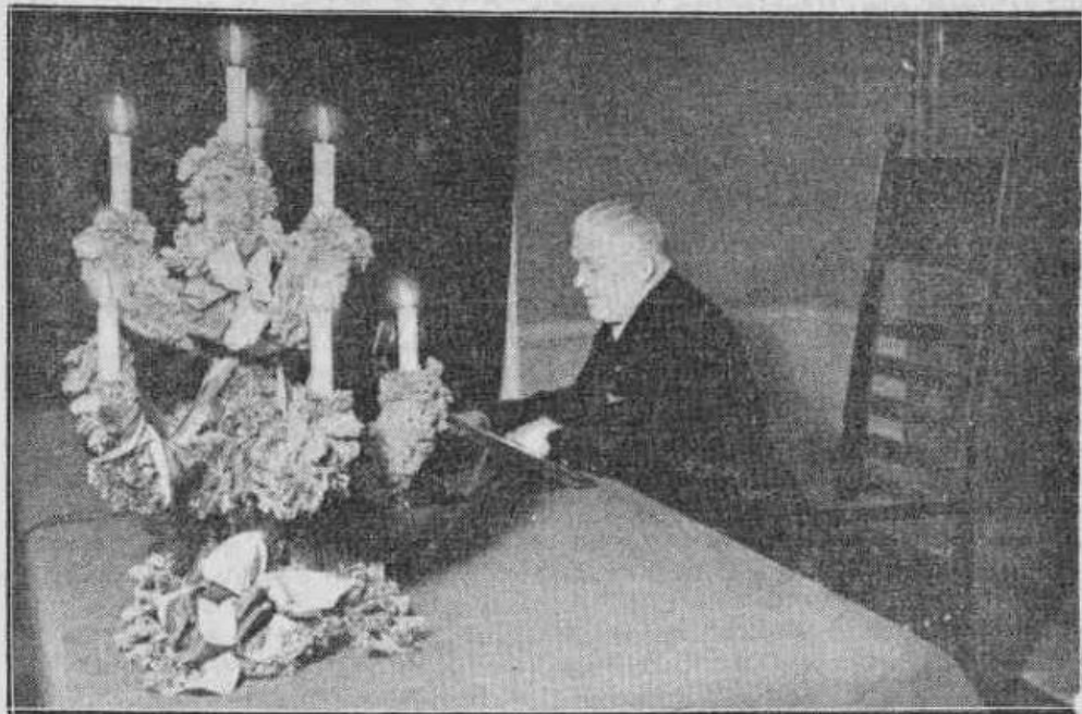
Valsts prezidents Kārlis Ulmanis no Pils pa radio uzrunā vakarēšanas dalībniekus Lugažos.

300 lugažnieku noklausas Valsts prezidenta uzrunu