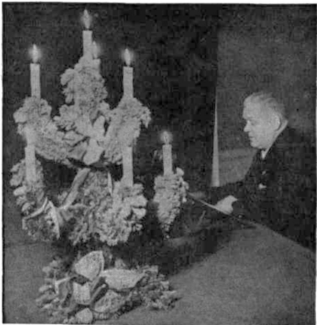
Valsts Prezidents KĀRLIS ULMANIS Pīļ savā darba istabā gaka runu Lugažu vakarēšanas gadījumā.