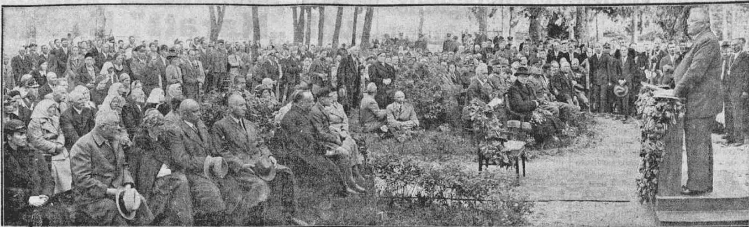
Valsts prezidents Lugažu pamatskolā uzrunā vakarēšanas dalībniekus. Pirmā rindā iekšējo ministru V. Gulbis. Atz. ministra vakarēšanas ierosinātājs Lugažu pag. lauksaimnieks J. Pavlovičs. (Skat. tekstu 1. lappusē.)