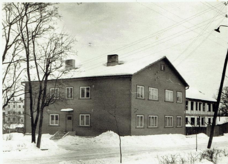
Dzīvojamais nams Šorkija ielā.