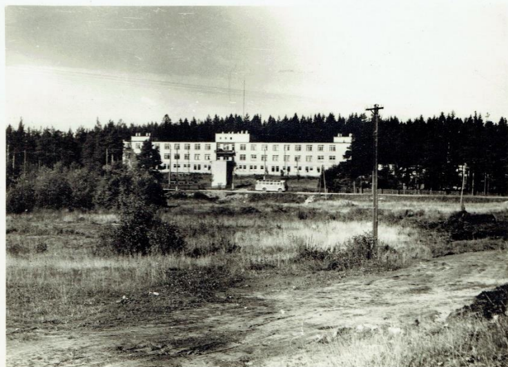
rajona slimnīca Valkā.