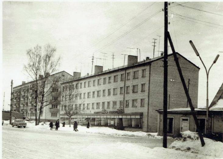
Gastronomijas veikals Raiņa ielā.