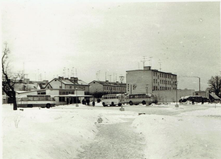
Auto osta un