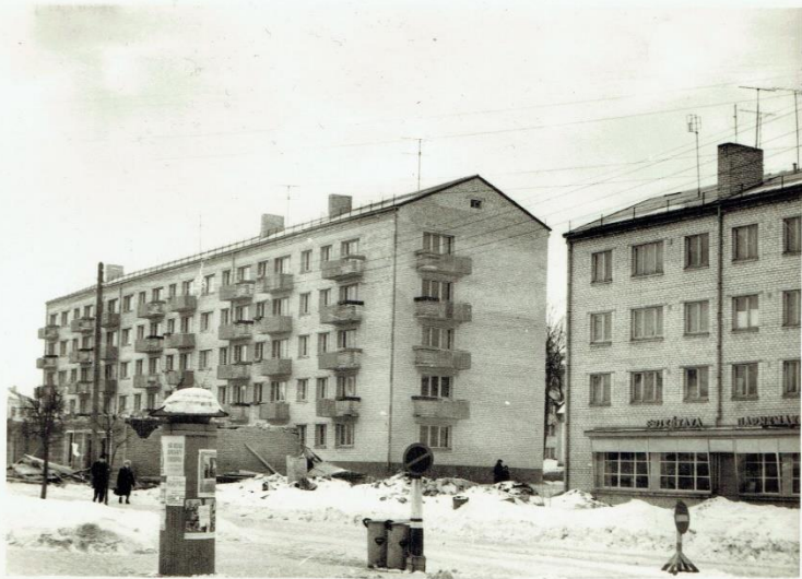
Dzīvojamie nami un