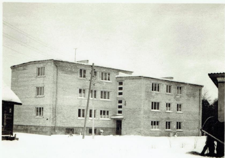
Pelioratoru dzīvojamais nams Kūru ielā.