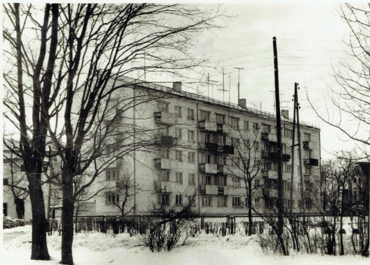
Dzīvojamais nams Jālavas ielā.