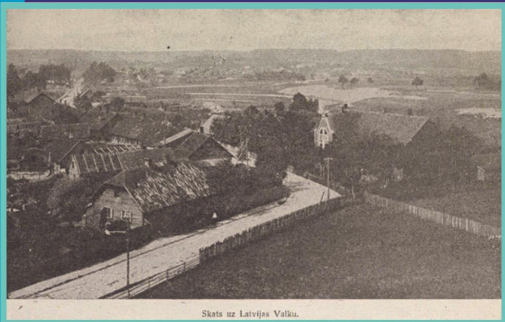
Skats uz Latvijas Valku.

“Cik savādi! Nevienam nenāks prātā runāt un rakstīt par Latvijas Rīgu, Latvijas Liepāju, Latvijas Jelgavu. Minot šīs pilsētas, mēs arī bez Latvijas nosaukumiem atzīsim tās par savām. Valka šai ziņā ir izņēmums. Pēc Valkas sadalīšanas starp Latviju un Igauniju, Latvijai piešķirtā daļa ir tapusi par Latvijas Valku.”