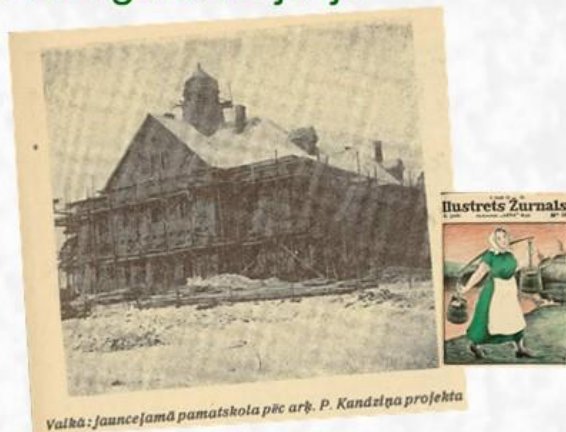
Valkā: jauncejamā pamatskola pēc arh. P. Kundziņa projekta