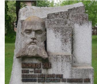
Indriķis Zīle, 1841. — 1919.