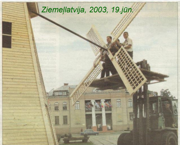
Ziemeļlatvija, 2003, 19.jūn.

SIA «Valkas meži» speciālisti uzstādā kultūras nedēļas galveno simbolu — laikmeta dzīmas, kurām jāsauc atpakaļ pasaulē izkļūdušie valcēnieši.