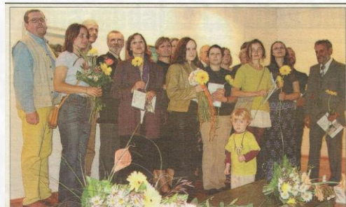
Izstādes «Veltījums Valkai» dalībnieki ekspozīcijas atklāšanā 2. starptautiskās pierobežas kultūras nedēļas laikā.

Valkas novadpētniecības muzejs gatavojas 1. vispasaules valcēniešu salidojumam